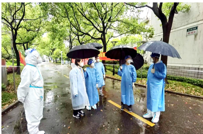
金力在邯郸校区调研